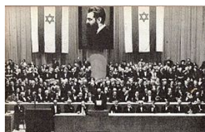
Herzl and the Zionist Congress

This week we reviewed all the terms learned in the "History of Zionism" lessons (show your kids the photos and review the terms with them):