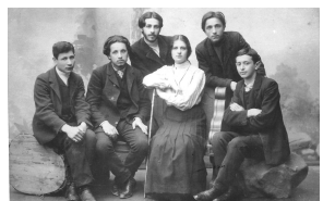
Pioneers - immigration and settlement