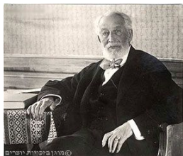
Rothschild- financial supporter.