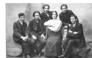
הקשיים של החלוצים - ייבוש הביצות, רכישת אדמות, ייצור עצמאי.