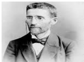
Eliezer Ben Yehuda (Revival of the Hebrew Language.)

Today we were introduced to another important figure who supported the pioneers, answering questions related to observance of mitzvot and Halacha: