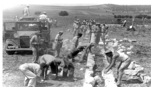
Difficulties the pioneers faced- drying swamps, land acquisition, become self-sufficient.